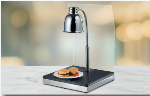
Single mit Hustenschutz Single with cough protection