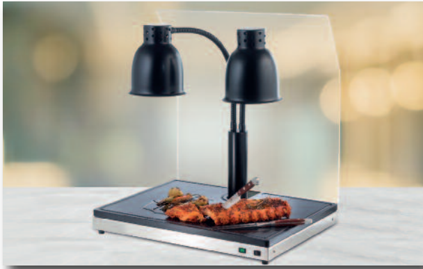
Dual mit Hustenschutz Dual with cough protection